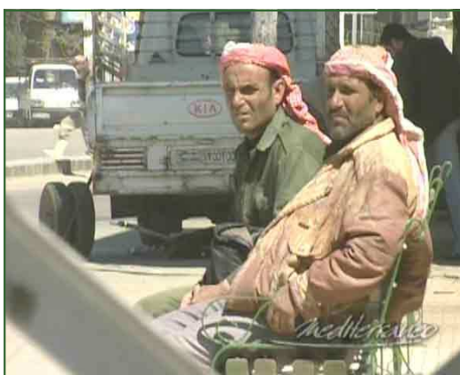
Liban. Gwenaëlle Lenoir, photo d'Emmanuel Vigier. Depuis l'assassinat de l'ancien Premier ministre libanais, Rafic Hariri, en février 2005, la Syrie est pointée du doigt par la communauté internationale.

Un roman policier comme un témoignage de la détresse humaine